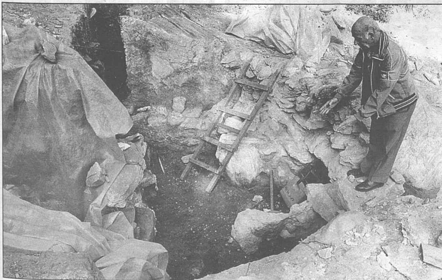
Blick in den frühmittelalterlichen Kalköfen. Die imposante Ausmasse lassen den Holzbedarf (Holzkohle) erahnen!