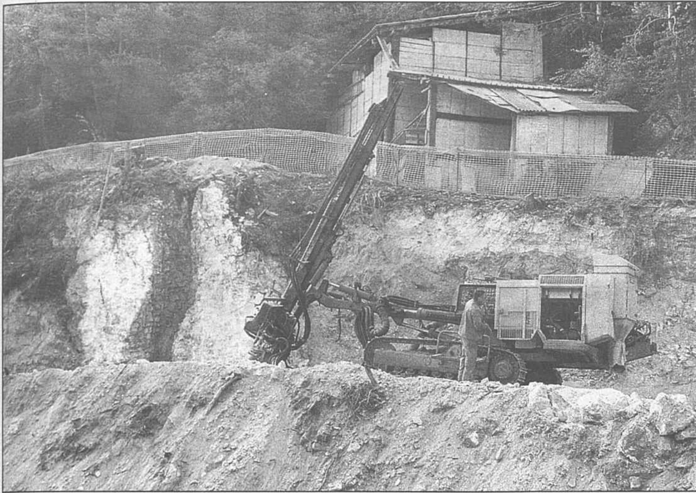
Mit schwerem Geschütz und vernichtender Kraft greifen die Maschinen in das gipshaltige Gestein in der «Kriden Fluh» und ebnen der künftigen A 9 das Trassee. Die ältesten Spuren der Gipsausbeutung weisen die Archäologen in die römische Epoche.